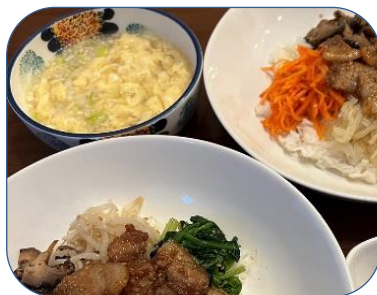
「サムギョプサルビビンバ」と「干しダラのスープ」