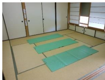
ヨガマットを並べるとこんな感じです