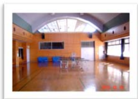
レクリエーションホール