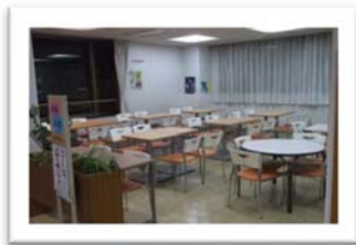
娯楽・飲食・囲碁コーナー