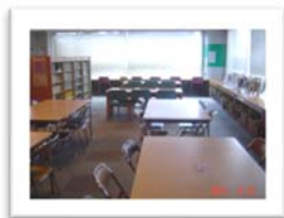
図書・勉強コーナー