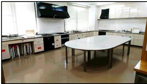
楕円型のテーブルで会話に花が咲きます☺